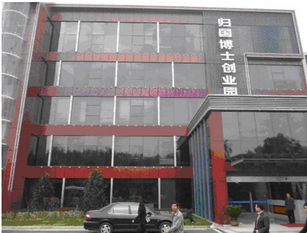
南京归国博士创业园企业启用的第一天