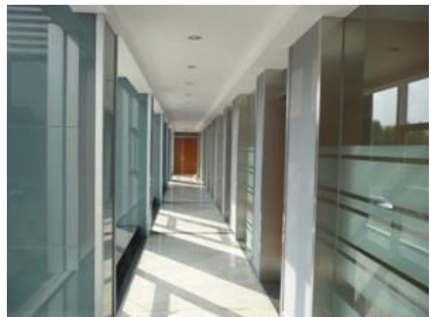
南京光威能源科技公司宽敞明亮的办公区（三楼）